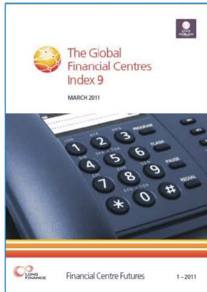
(The Global Financial Centres Index9)

Top20榜单上占到8个席位, 而北美和欧洲分别占6个、5个席位。其中, 首尔上升最快, 居第十六位。